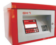
● Consola GK7

La Serie GK7 de equipos de suministro y/o control esta compuesta por distintos modelos de producto que se pueden adaptar a flotas de vehículos de pequeño, mediano tamaño y grandes flotas. De fácil instalación y utilización. Disponen de un software con funcionalidades muy completas.