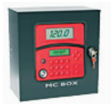
● MC Box 80 ● MC Box 120

La Serie MC de equipos de suministro y/o control esta compuesta por distintos modelos de producto que se pueden adaptar a flotas de vehículos de pequeño y mediano tamaño, de fácil instalación y utilización. Disponen de un software sencillo y de fácil manejo.