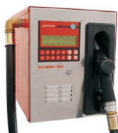
● Mini 46K - 60 ● Mini 46K - 130 ● Mini 88K - 60 ● Mini 88K - 130