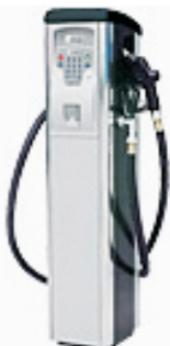
● Self Service 70 MC FM ● Self Service 100 MC FM