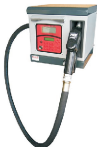
● Cube 70 MC