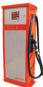
● SHK-70C 130 / 1000 ● SHK-130 C 130 / 1000 ● SHK-70CD 130 / 1000 ● SHK-130CD 130 / 1000